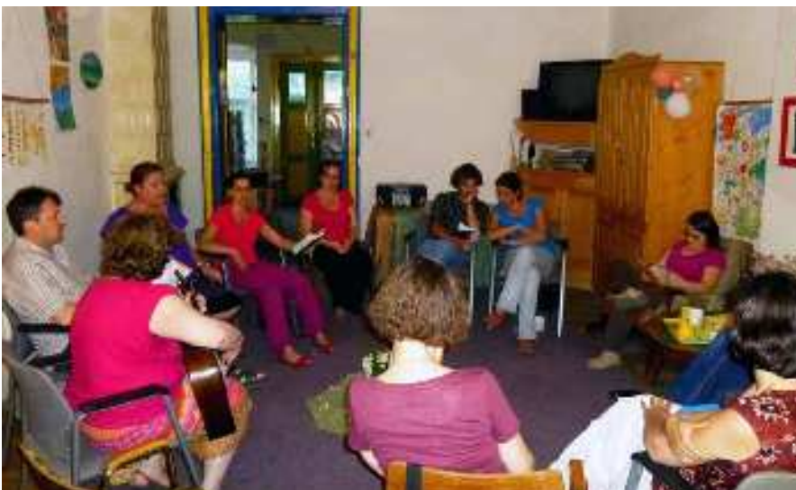
Bibelarbeit in den Räumen des Philothea-Treffpunkts im Zentrum von Targu Mures.