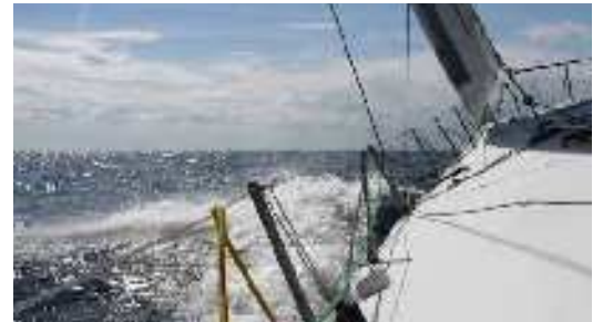
Segel setzen und aufbrechen