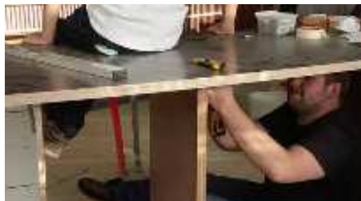
Ab in die Zukunft