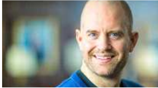
U-Turn zu Gott