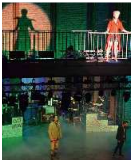
Auftritt von »Red«, der Anführerin einer Jugendgang

Am Ende winkt natürlich das Happyend: Die Jugendlichen beenden ihren Aufstand und finden Gehör.