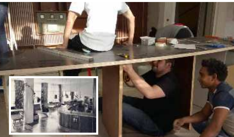
Früher wurden hier Gäste aus aller Welt begrüßt, später diente sie als Archiv für Dokumente und heute soll ihr neues Leben eingehaucht werden.

Mehr zur KULTurLOUNGE erfährst du unter: www.cvjm-bremen.de facebook.com/cvjmbremen