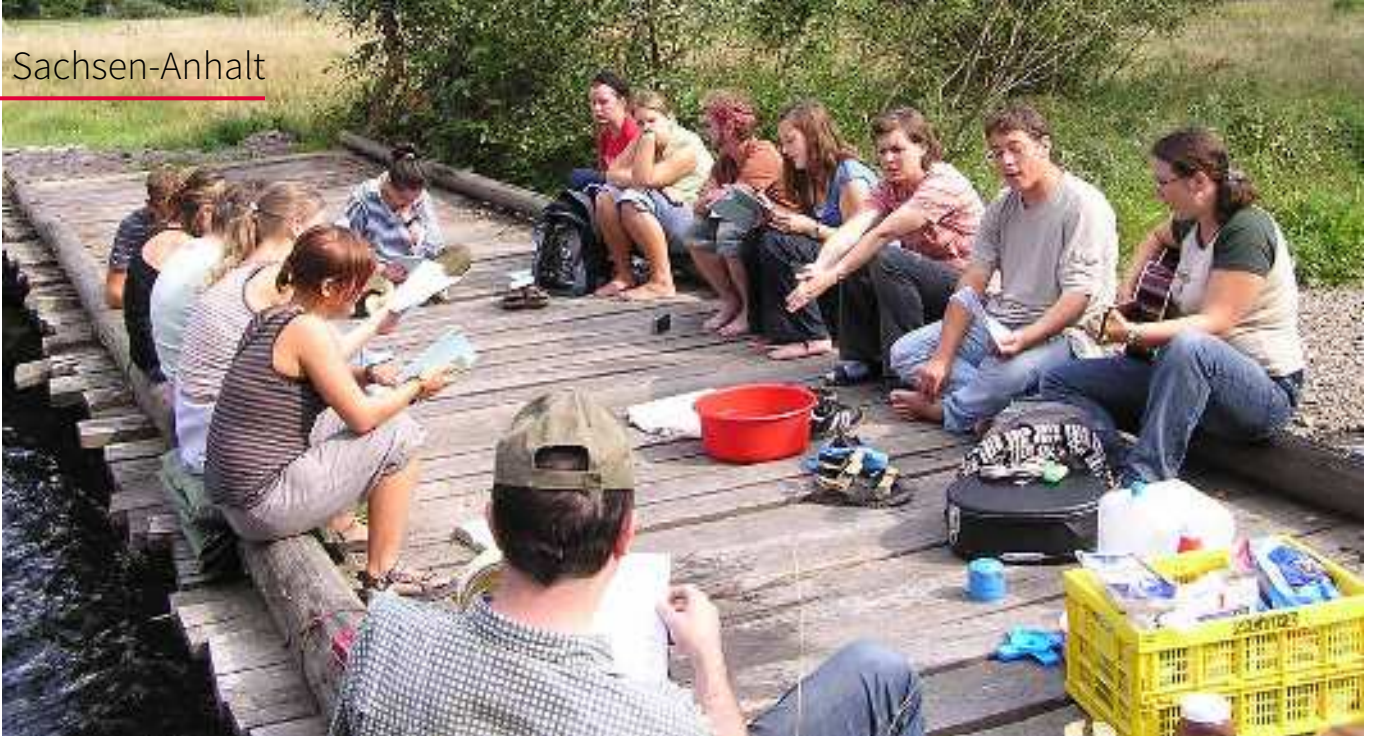
Jugendfreizeiten in der Natur haben eine besondere Bedeutung für die Arbeit von »Philothea«.